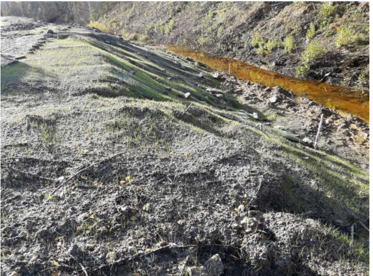
Промежуточный результат 10.10.2018г.