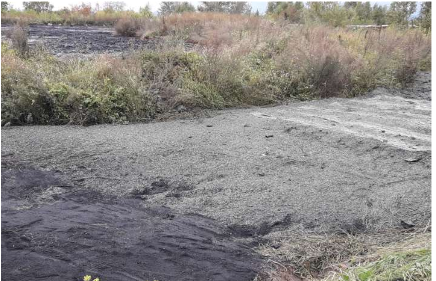
Обработка шлака и смолы 14.09.2018