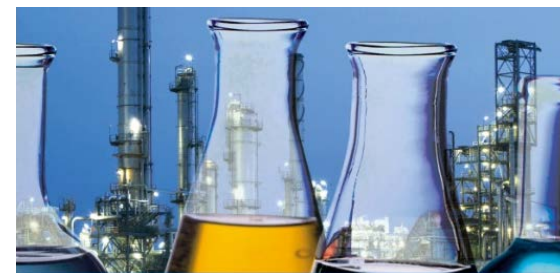
Декантеры в фармацевтике, химии, пищевой промышленности