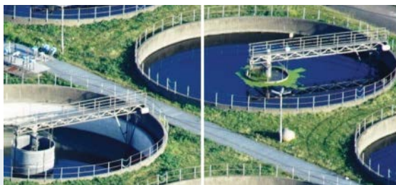
Центрифуги для обработки осадка коммунальных сточных вод

За 25 лет мы установили и успешно поддерживаем свыше 300 декантеров, сепараторов, ленточных прессов и комплексных установок в России и СНГ в различных отраслях промышленности.