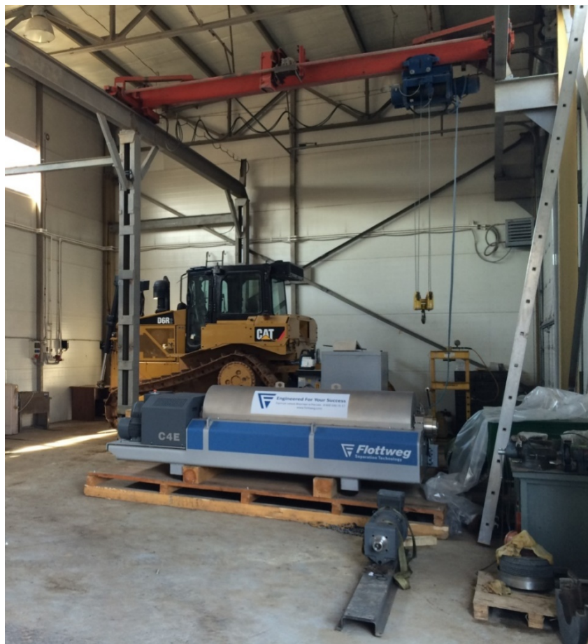
Наш сервисный цех