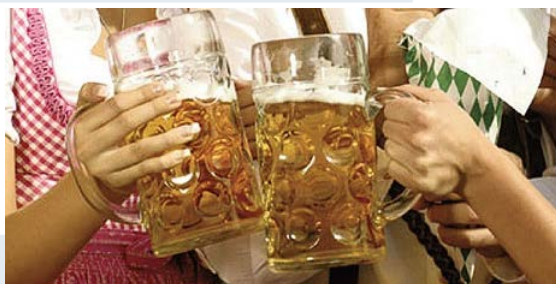
Сепараторы для пива, ленточные прессы для соков